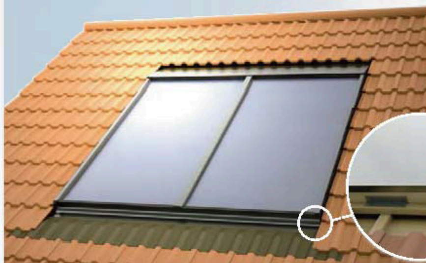
Tabla flexibilă adaptată la cele mai uzuale țigle, verificată special în laboratorul Solarbayer, garantează o tranziție perfectă de la câmpul colectorului la acoperișul existent, în conformitate cu regulile consacrate ale construcției de acoperișuri. Sunt disponibile seturi de tablă pentru aproape toate tipurile de acoperiș.

Colectoarele pentru interiorul acoperișului pot fi montați la înclinările acoperișului mai mari de 25°. La înclinările mai mici ale acoperișului, vă rugăm să solicitați consultanță pentru fiecare caz particular, în parte.